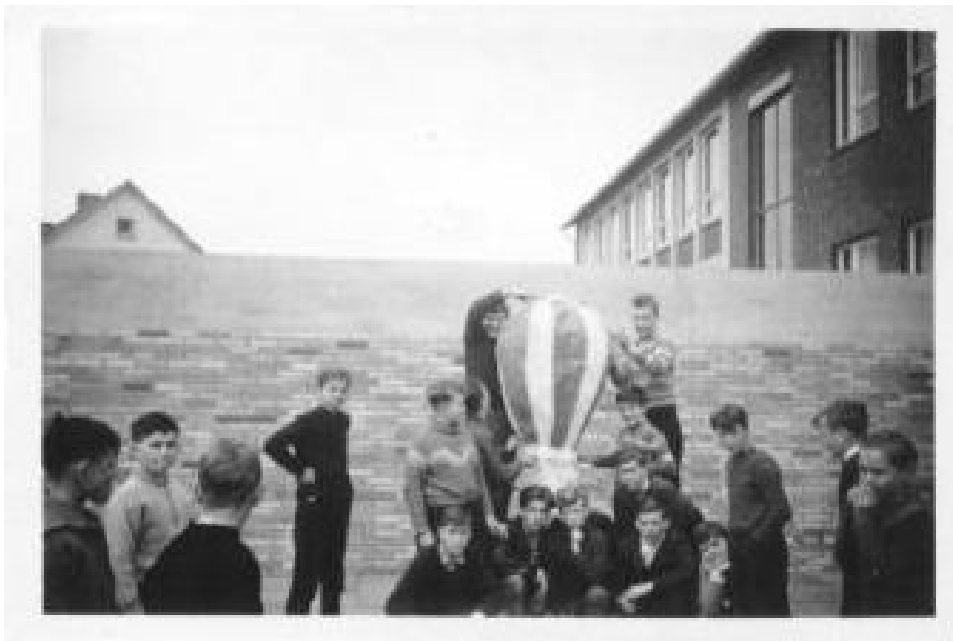
Auf dem Pausenhof der Agnes Miegel Schule. Die evangelische Jungenklasse 1961 beim gelungenen Start des Heißluftballon.