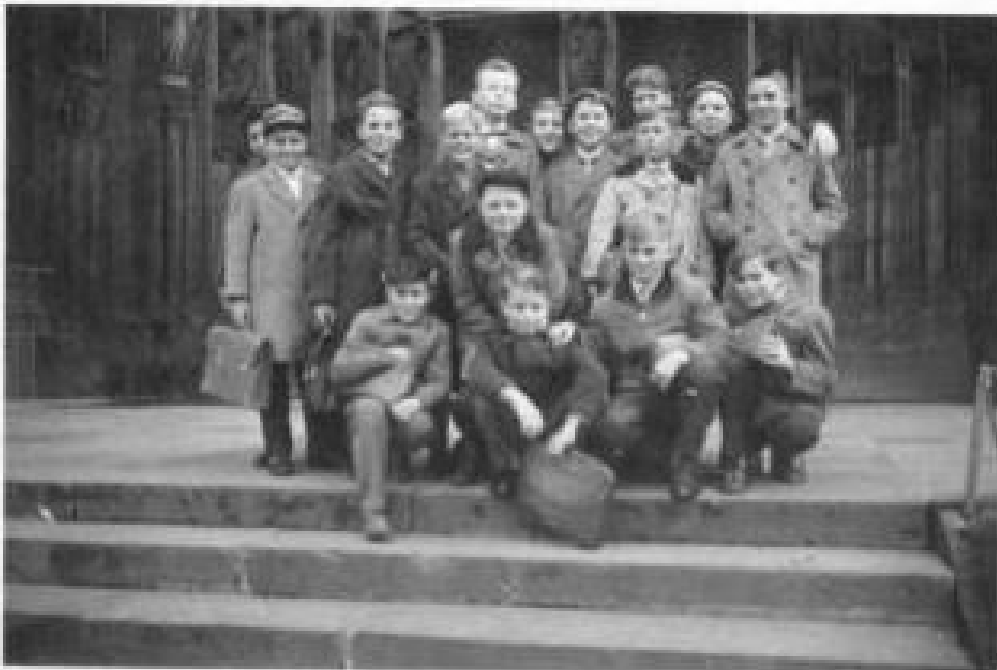
Die Jungenklasse vor dem Kölner Dom