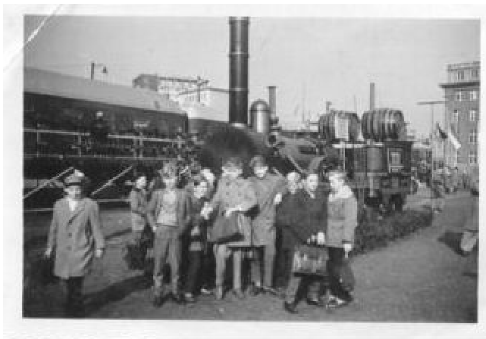
Erinnerungsfoto vor dem „ Adler „