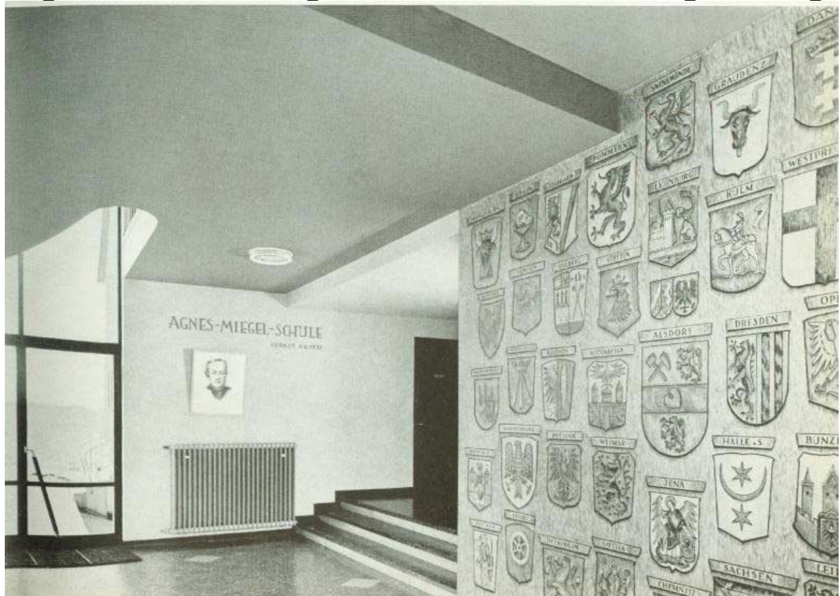
In der Eingangshalle waren alle Wappen der Ostdeutschen Gebiete zu finden