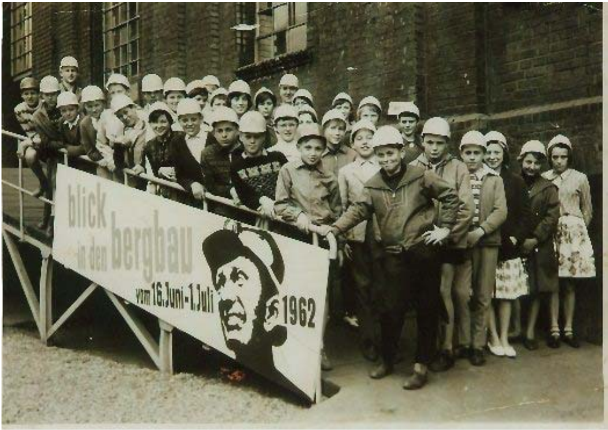
Alsdorf – EBV Berglehrwerk 1962