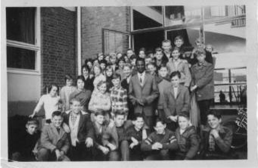
Afrika als Projekt und Besuch aus Afrika 1959