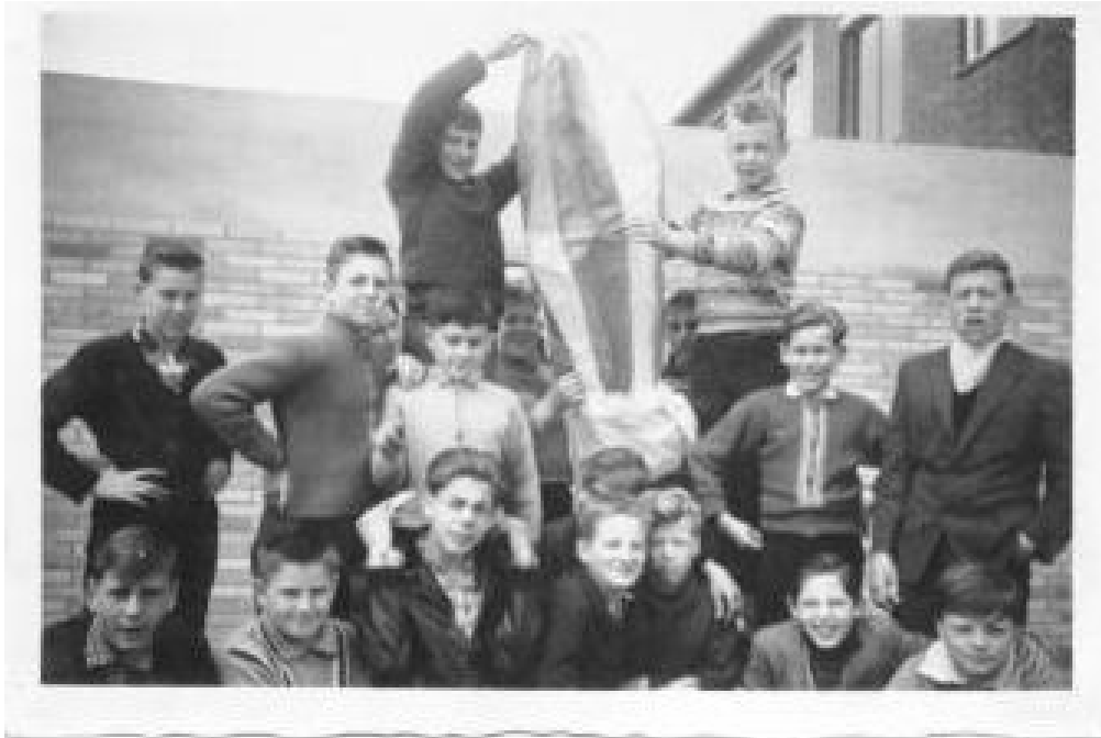
der Nachbaut eines Heißluftballon der Gebrüder de Montgolfier ist gelungen.